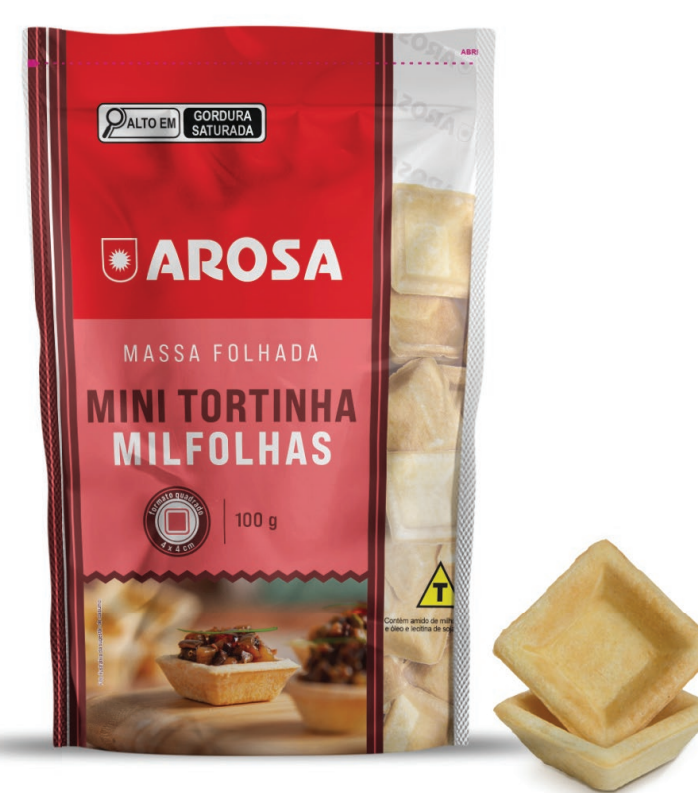
Mini Tortinha Milfolhas 27 unidades Cód. 6130 Medidas: 4 x 4 cm Cabe 5 g de recheio 789609126130 6