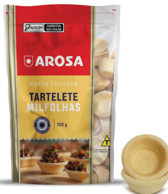
Tartelete Milfolhas 25 unidades Cód. 6132 Diâmetro: 4,5 cm Cabe 6 g de recheio 789609126132 0