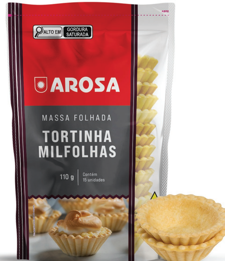
Tortinha Milfolhas 15 unidades Cód. 6007 Diâmetro: 7 cm Cabe 20 g de recheio 789609126007 1