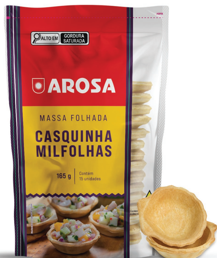
Casquinha Milfolhas 15 unidades Cód. 6018 Diâmetro: 7 cm Cabe 25 g de recheio 789609126018 7