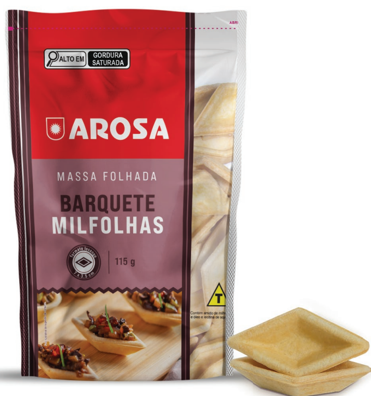
Barquete Milfolhas 36 unidades Cód. 6136 Medidas: 7 x 3,5 cm Cabe 3 g de recheio 789609126136 8